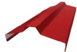
Ветровая/торцевая планка резная MARYNA